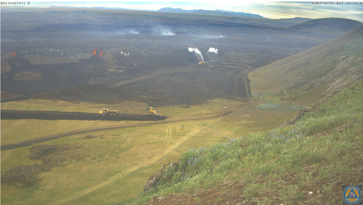
Hrauntungurnar sem renna yfir varnargarð norðan Sýlingarfells og vinna við að hemja hraunrennslið.