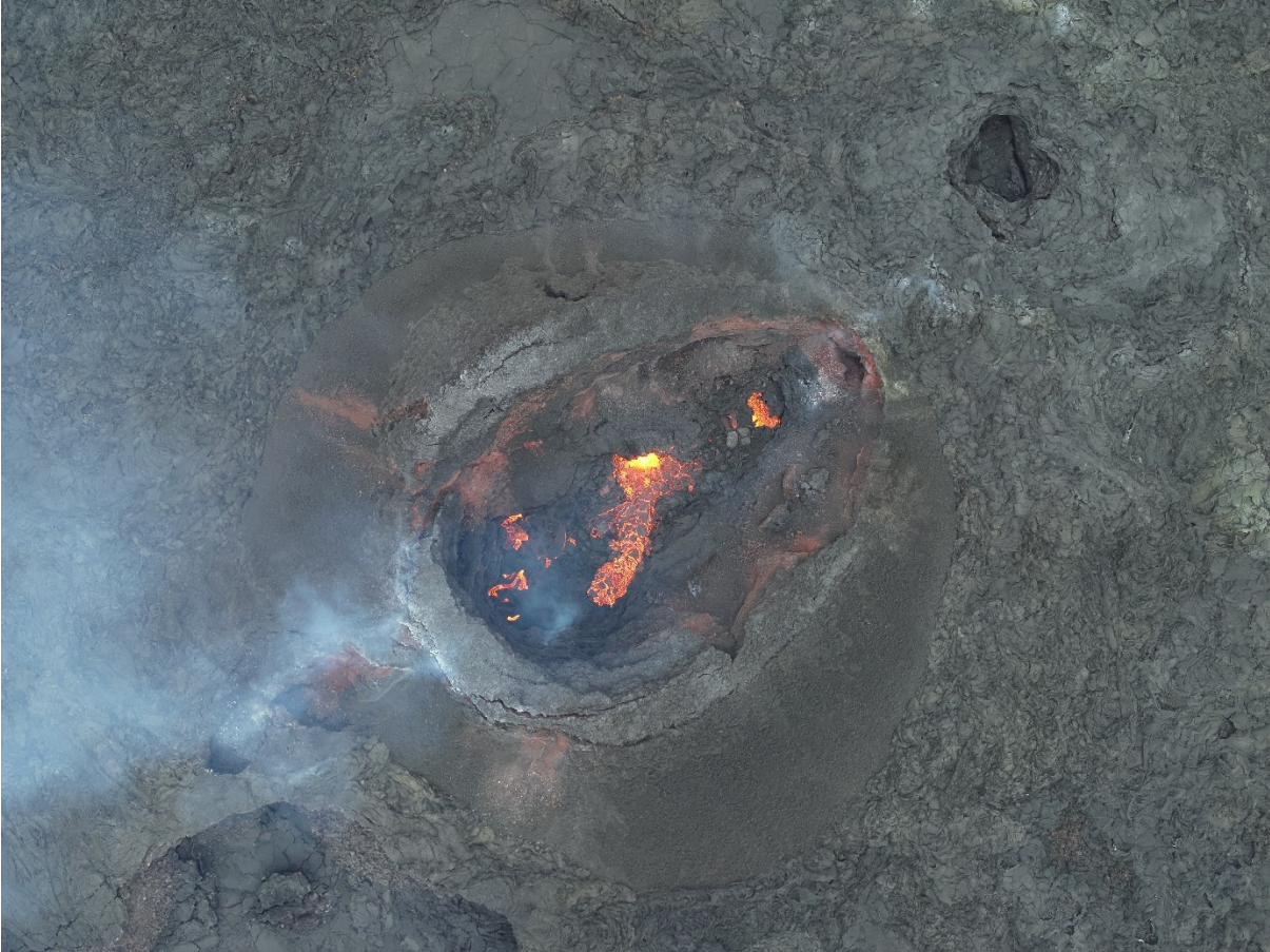
Mynd af gígnum sem tekin var um kl. 9:30 í morgun í drónaflugi Almannavarna yfir gosstöðvarnar.