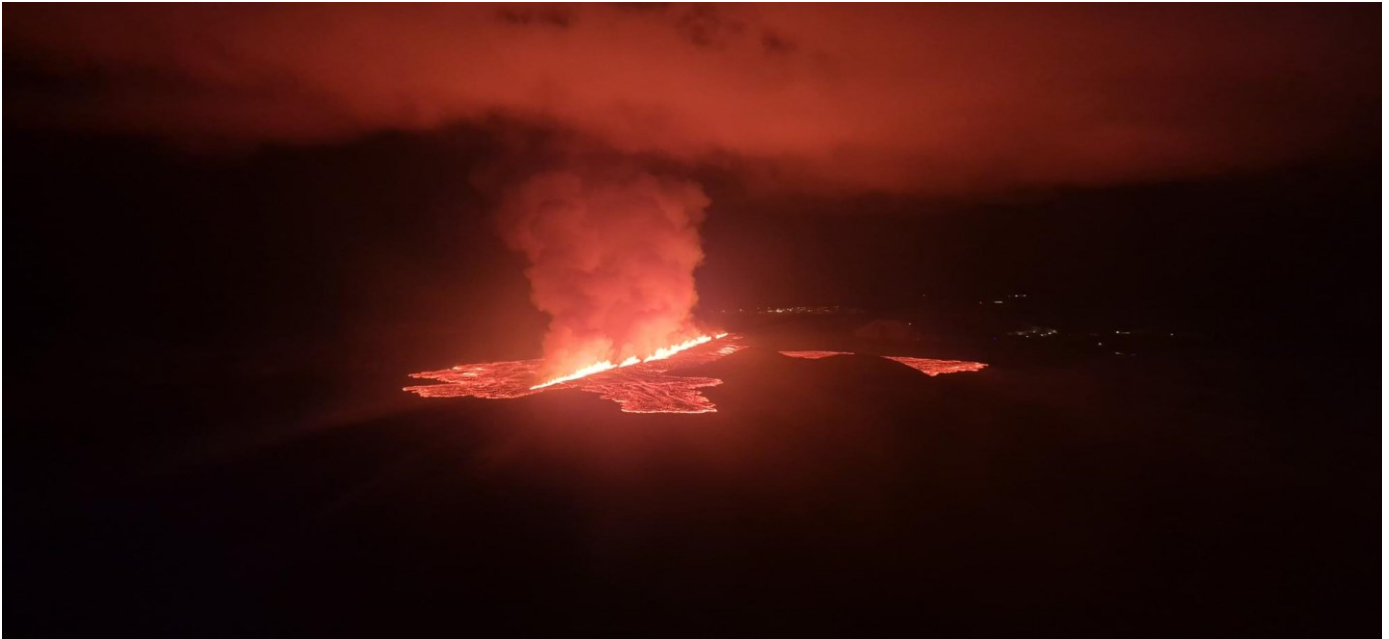
Mynd úr eftirlitsflugi með Landhelgisgæslunni. Ljósín í Grindavíkurbæ sjást í fjarska. Ljósín í Svartsengi hægra megin á myndinni.