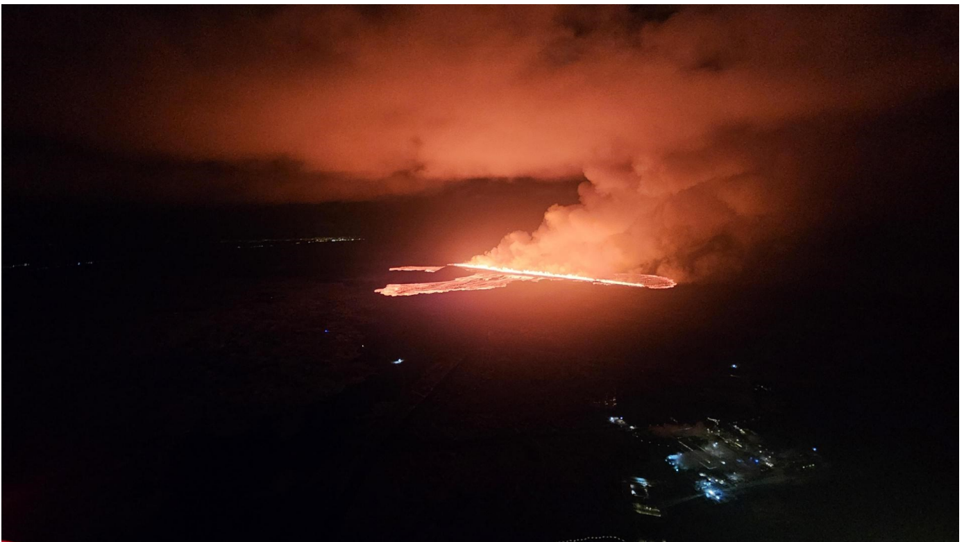
Mynd sem sýnir hraunstraum í vestur í átt að Grindavíkurvegi. Ljósín í orkuveri HS Orku í forgrunni.